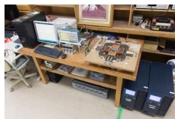
〔測定システム(一例)〕

( http://www.nbu.ac.jp/~wakabayashids/index.html )